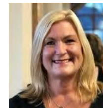
Gayle Gorman Àrd-neach- sgrùdaidh na Banrigh airson Foghlam

Tha mi an dòchas gun cuidich toraidhean na h-aithisg seo luchd-cleachdaidh air feadh Alba a leantainn orra a' fàs is a' leasachadh chothroman planaichte de chàileachd air ionnsachadh air a' bhlàr a-muigh do chloinn is daoine òga.